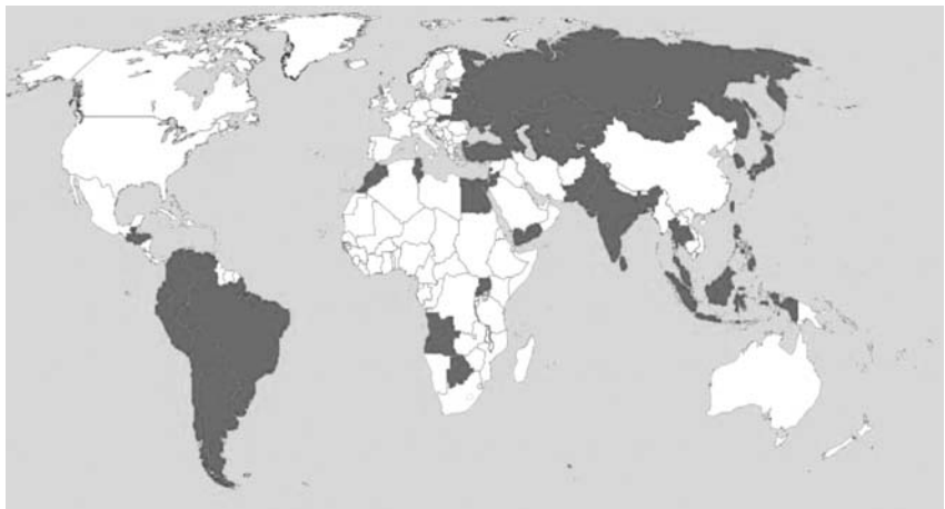
Рис. 2. Распределение демократий с прилагательными на карте мира.

Всего на регион приходится тридцать один признак из сорока пяти, выявленных в текстах с разными концептами «демократий с прилагательными». Отсутствует аполитичность населения, использование религиозных принципов в качестве политической платформы.